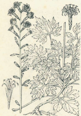
第 41 圖

山地ニ多ク生ズル多年生ノ小草本ニシテ 莖ノ下部ニ葉ヲ互生シ、葉々相接ス。其 葉ハ長柄ヲ具ヘ、淺ク三九裂シ、三角 狀圓形ヲ成シテ稍龜甲ノ狀アリ、莖葉共 ニ短毛ヲ有ス。秋月、葉心ヨリ 10-20cm 許ノ花軸ヲ抽キ、穗狀様ヲ成シテ十箇内 外或ハ多數ノ短梗頭狀花ヲ着ク。各頭狀 花ハ白色五裂ノ管狀小花三箇ヲ收メ一輪 花ノ狀ヲ呈ス。瘦果ハ茶褐色ノ冠毛ヲ有 ス。