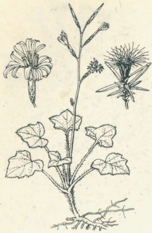
第 40 圖