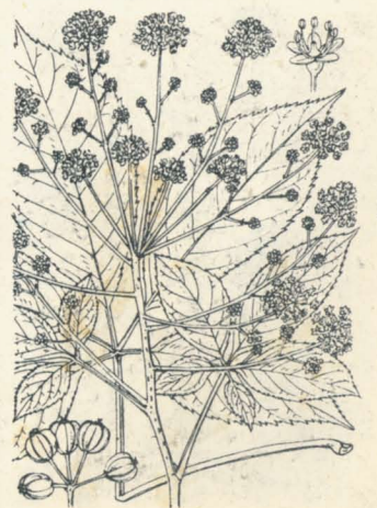
第 855 圖

山林中ノ落葉喬木ニシテ高サ16m許、徑60cm許ニ達シ、幹ハ直上シ樹膚ハ灰褐色、枝極ハ灰白色ヲ呈ス。葉ハ互生シ基部短柄ヲ呈セル長柄ヲ具ヘ五出掌狀複葉ヲ成シ、小葉ハ短柄アリテ倒卵狀橢圓形、長サ10-20cm許、先端尖リ底部銳形或ハ楔形、刺狀鋸齒縁、質薄ク稍硬ク、裏面ハ淡色ニシテ脈上淡褐色ノ軟毛アリ。夏日開花シ、繖形花序ハ長梗アリテ枝端ニ集合シ、複繖形ノ觀アリ。花ハ小形ニシテ多數、淡綠黄色。萼ハ五小片アリ。花瓣五片、平開シ卵狀橢圓形。雄蕊五、挺出、黄約。子房ハ下位、二花柱。漿果ハ小球形、稍平扁、平滑、秋ニ入りテ黒紫色ニ熟シ長サ5mm許。和名ハ瀝し油ノ意ニシテ往昔此樹ヨリ樹脂液ヲ採リ、之レヲ瀝シテ塗料ニ使用セン故此名アリ、又ごんぜつハ金漆ニシテ其特別ナル塗料ヲ云ヘリ。