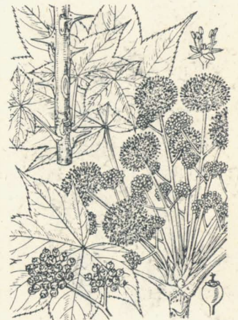
第 854 圖

廣ク諸州ノ山地ニ生ズル落葉喬木ニシテ高サ25m内外ニ達シ、周圍3m内外ニ及ブ。幹ハ直立高聳シ、樹膚ハ粗糙ナル裂罅アリテ暗褐色ヲ呈シ、枝極ハ粗大ニシテ尖刺多シ。葉ハ互生シ、枝頭ニ相集リテ出デ、長柄ヲ有シ、七或ハ九裂シテ掌狀ヲ呈シ、裂片ニ細鋸齒アリ、裏面ハ稍毛ヲ帶ブ。五月頃、枝端ニ數花軸ヲ叢出シテ分枝シ、枝端ニ球形ノ繖形花穂ヲ成シテ多數ノ黄綠小花ヲ開ク。四或ハ五花瓣、四或ハ五雄蕊、下位子房、二裂花柱アリ。果實ハ球形ニシテ藍黒色ニ熟ス。材ヲ下駄竝ニ器具等ニ製ス。