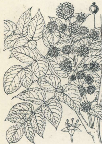
第 851 圖

多年生草本ニシテ山地樹下ニ生ジ、高サ 60cm 内外アリ。根莖ハ長ク地中ニ横行シ、稍肥厚ニシテ白色ヲ呈シ、節アリ、毎節ニ莖ノ脱痕ヲ印ス。莖ハ單一ニシテ根莖頭ヨリ直立シ、頂ニ三、或ハ五ノ有柄葉ヲ輪生ス。葉ハ五小葉複葉ニシテ、小葉ハ卵形或ハ倒卵形或ハ披針形ニシテ葉縁ニ細鋸齒アリ。夏月、莖頭葉心ニ一梗ヲ高く抽キ、頂ニ球形ヲ呈セル繖形花穂ヲ成シ、淡黄綠色ノ多數小花ヲ開ク。梗梢時ニ一、二或ハ多數ニ分枝スルコトアリテ枝上ノ花ハ皆雌性花ナリ。五花瓣、五雄蕊、下位子房、二花柱アリ。果實ハ球形ニシテ相集リ、赤熟ス、時ニ其頂黒色ノ者アリ。和名とち葉人參ハ其葉形ニ由リ、竹節人參ハ其根形ノ狀ニ基ツク。支那ニ竹節參アリ我邦品ト酷似セルモノナリ。漢名 土參(誤用)