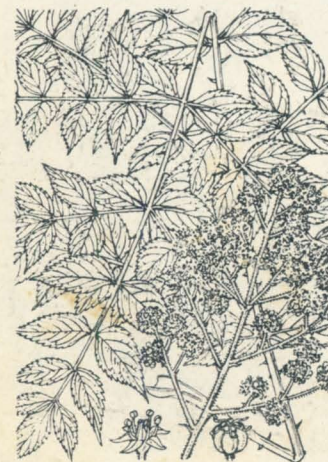
第 852 圖

たらのき Aralia elata Seem. 落葉灌木ニシテ山野ニ多ク生ジ、高サ3-4m許、直幹直立シ單一或ハ分枝シ、大小ノ強鋭刺ヲ裝フ。幹徑大ナル者凡12cm許アリ。葉ハ大形ニシテ互生シ、梢頭ニ集リ着テ四方ニ傘開シ、基部放大抱莖セル葉柄ヲ有シ再羽狀複葉ニシテ、總葉軸・支葉軸ニ棘刺アレドモ老葉ニハ之レナシ。小葉ハ對生シ、多數ニシテ卵形ヲ呈シ鋸齒アリ、裏面帶白多少有毛、或ハ多毛(めだら)ナリ。花穂ハ八月頃梢頭葉心ニ出デ少數或ハ多數ノ圓錐花ハ短矮ナル總軸ヨリ開生シテ白色ノ小花ヲ滿開ス。五花瓣、五雄蕊、下位子房、五花柱アリ。漿果ハ小球形ニシテ黒熟ス。山民嫩芽ヲ採リたら芽ト稱シ食フ、うどんノ香味アリ。漢名 椴木(誤用、是レ支那たらのきの名ナリ)