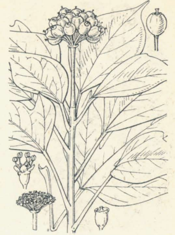
第 853 圖

常綠ノ小喬木ニシテ暖地ノ山林中ニ生ジ、又往々庭樹トシテ用キラル。高サ9m内外ニ及ビ、幹ハ直立シテ分枝ス。葉ハ枝梢ニ互生シテ長短ノ葉柄ヲ具ヘ、質厚クシテ毛ナク、滑澤ニシテ三主脈ヲ具フ。若木ノ葉ハ多ク五深裂シテ闊ク、老木ニテハ全邊ニシテ倒卵形或ハ卵形ヲ呈シ、又倒卵形ニシテ三裂者ヲ交ユルコト多シ。夏月枝端ニ單一或ハ分枝セル有柄ノ繖形花穂ヲ成シテ有柄ノ淡黄綠色花ヲ綴ル。五花瓣、五雄蕊、下位子房、五花柱アリ。果實ハ廣橢圓形、黒熟。和名隠蓑ハ其葉ヲ身ヲ隠スニ着ルト云フ蓑ニ擬ヘシナリ。