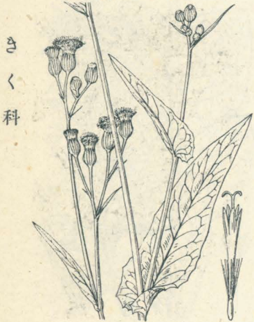
第 83 圖

九州種子島・屋久島ニ生ズル常緑多年生草本。葉ハ根生シ、長キ葉柄アリテ叢生ス。心臟形ニシテ邊緣ニ缺刻及ビ鋸齒ヲ有ス。葉面往々金屬光澤アリ。叢葉中ヨリ花莖ヲ抽クコト 30-60cm、晩秋初冬ノ頃梢ニ花梗ヲ分チテ黄色頭狀花ヲ著ケ、周邊ニ一列ノ舌狀花アリ。