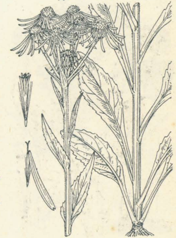
第 86 圖

向陽ノ山地高原ノ草地ニ生ズル多年生草本。莖ハ瘦長ニシテ直立シ高サ 50cm 内外アリテ枝ヲ分タズ、上部ニ至ルニ從ヒ白色ノ綿毛稍著シ。根葉ハ匙形、邊ニ鈍鋸齒アリテ有翼ノ長柄ヲ具フ。莖葉ハ互生シ披針形ニシテ齒牙緣ヲ刻ミ、葉柄ハ短クシテ底部ハ稍莖ヲ抱ケリ。頭狀花ハ八月開花シ、莖梢ニ繖房狀ヲ成シテ數箇ノ頭狀花ヲ着ケ、徑 2cm 内外アリ。總苞片ハ紫褐色ヲ呈シ、又白綿毛アリ。舌狀花ハ十乃至十五、花冠ハ線形ニシテ下垂シ濃柑赤色ノ特異色ヲ呈スルヲ以テ大ニ草中ニ異采ヲ放テリ。和名ハ紅輪花ノ意ニシテ花色丹色ナレバ云フ。