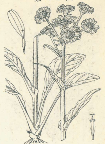
第 85 圖

濕地ニ生ズル多年生草本。根生葉並ニ脚葉ハ長柄ヲ有シ、梢葉ハ無柄ニシテ莖ヲ抱ク。披針形、質厚ク、深綠色ヲ呈シ、毛ナク或ハ多少白綿毛ヲ帶ブ。晩春莖ヲ抽クコト 60-90cm、中空ニシテ粗大ナリ。初夏莖頭ニ多クノ枝ヲ分チ黄色ノ頭狀花ヲ着ク。一種山原ニ生ジ、形之レヨリ小ニシテ、莖葉ニ白毛ヲ帶ブルモノヲをかをぐるま(狗舌草)ト云フ。