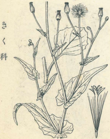
第 84 圖

東部印度ノ原産ニシテ觀賞ノ爲メ庭園ニ培養スル一年生草本。莖ハ分枝シ、高サ 30-60cm 許、葉ハ互生シ、脚葉ハ有柄ナレドモ莖葉ハ無柄ニシテ箭形ノ葉底ヲ以テ莖ヲ抱キ、葉緣多少波狀ヲ呈シ、不齊ノ低尖起ヲ有ス。夏日長枝上ニ赤色或ハ時ニ柑黄色ノ頭狀花ヲ着ケ、各多數ノ管狀花ヲ有シ、子房ニ冠毛アリ。本種ハ花期頗ル長シ。