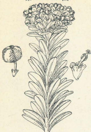
第 1126 圖