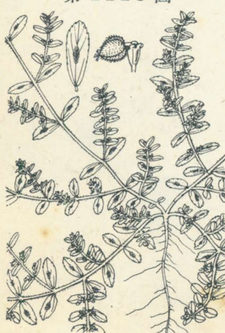
第 1128 圖

畠地或ハ砂地等ニ生ズル一年生ノ小草本。莖ハ株本ヨリ多數ニ分岐シ、多枝ヲ岐チテ地面ニ場臥シ、紅色ニシテ多少ノ毛アリ、切レバ白汁ヲ出ス。枝ハ通常二岐ス。葉ハ小ニシテ長サ5-10mm許、地平ニ開キテ二列生ヲ成シ、葉面綠色ニシテ質薄ク毛ナク、裏面ハ白綠色ヲ呈ス。長橢圓形ニシテ葉縁ニ細鋸齒アリ、葉端ハ圓ク、底部ニ極メテ短キ葉柄アリ。托葉ハ線形ニシテ通常三深裂ス。夏秋ノ間、枝ノ先端或ハ葉腋ニ一見一花ノ如キ淡赤紫色ノ小花序ヲ着ク。鐘狀ノ小總苞口ニ在ル腺體ハ横ニ橢圓形ヲ成シ附屬體アリ、總苞中ニ一雄蕊ヨリ成ル數雄花ト一雌蕊ヨリ成ル一雌花トアリテ雄花ノ間ニハ線形ノ小苞片アリ。蒴果ハ小形、三耳、扁卵形、無毛、三殻片ニ開裂ス。和名錦草ハ莖紅葉綠ノ美容ニ基ク。漢名 地錦(慣用)