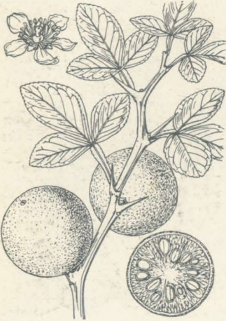
第 1163 圖

暖地ニ栽植セラルル常緑ノ小樹ニシテ高サ凡2.5mニ達シ、枝多シ、刺ハ短形ニシテ剛硬ナリ。葉ハ互生シ、長橢圓形ヲ成シ、鈍頭、邊緣ニ微鋸齒ヲ有ス。長サ10cm内外。葉柄ハ無翼。初夏、梢葉腋ニ圓錐花序ヲ成シテ白色ノ五瓣花ヲ着ク。花瓣ハ大ニシテ長サ23mm、上部ハ白色、脚部ハ赤紫色ヲ帶ブ。萼ハ短クシテ1cm許、先端五裂ス。雄蕊ハ三十箇内外。果實ハ冬ニ至リテ黄熟シ、形チ長ク、基部圓形ヲ呈シ上部ハ分裂シテ宛モ十餘指ヲ駢ベタルガ如キ畸形ヲ呈ス、故ニ佛手柑ノ名ヲ得タリ。しとろんナルまるぶしゅかん即チ枸櫞ノ一變種ニシテ佳香ヲ放チ觀賞ノ品トス。