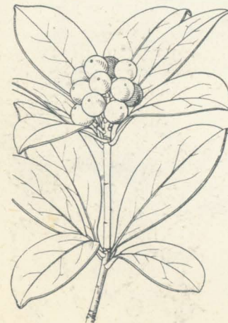
第 1164 圖

中央支那原産ニシテ古ク日本ニ傳來セリト考ヘラルル落葉灌木。邦内處ニヨリ野生ノ姿ヲ成スコトアリ、通常ハ生垣ニ用キラル、又うんしうみかんノ砧木トシテ多ク植エラル。幹ハ通常2m内外、老木ハ3m餘ニ達スル者アリ。枝ハ稜角アリテ多少扁平、綠色ヲ呈シ、強大ニシテ扁平ナル互生刺ヲ有シ、刺長5cmニ達ス。葉ハ三小葉ヨリ成ル複葉ニシテ葉柄ニ少シク翼アリ、秋日落葉スルヲ常トス。小葉ハ橢圓形乃至倒卵形、小鈍鋸齒アリ。春日葉ニ先チテ白色花ヲ開ク。花ハ大ニシテ單生、萼片五ニシテ離生、五花瓣アリ。雄蕊多數、子房ハ多毛ナリ。後直徑3cm許ノ圓果ヲ結ブ、黄熟シ芳香アレド食フニ耐ヘズ、枳實(眞物ニ非ズ代用ナリ)ト稱シテ藥用ニ供セラル。和名ハからたちはな即チ唐橘ノ略セラレシナリ、又きこくハ枳殼ノ字音ナレドモ元來枳殼ハ別ノ品種ナリ。