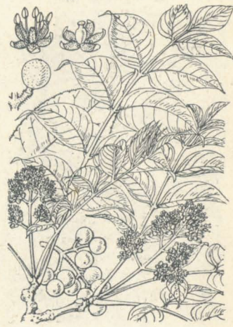
第 1166 圖

山地ニ生ズル常緑大灌木ニシテ普クハ之ヲ見ズ。高サ1-2m。樹形・花果等みやましきみに異ナラズト雖モ、葉ハ表面ニハ脈絡甚ダシク陥入シテ溝ヲ成シ、裏面ニハ隆起シテ畦狀ヲ呈セルヲ以テ區別セラル。みやましきみに比シテ稀品ナリ。枝近ク聚リテ互生シ稍輪生セルノ觀アリ、長サ10cm内外、長橢圓形、鋭尖頭、狭底、洋紙狀革質ニシテ淡黄綠色ヲ呈ス。雌雄異株。花ハ白色、四花瓣、四雄蕊、一雌蕊。果實ハ晩秋ニ入りテ紅熟シ球狀ヲ成ス。和名ハ打出し深山しきみにシテ葉脈ノ狀ニ基ク、然レドモ之ヲ上面ヨリ見ル時ハ實ハ打ち込みニシテ下面ニ打出セルナリ。