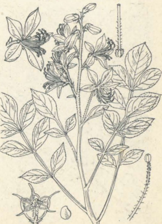
第 1167 圖

山地ニ生ズル落葉喬木。高サ15m内外ニ達シ、幹ノ外皮ハ淡黄褐色ニシテ厚キ木栓質ヲ成シ縦溝ヲ印シ、内皮ハ黄色ナリ。枝極ノ外皮ハ灰色ヲ呈ス。葉ハ對生シ奇數羽狀複葉ニシテ長サ20-30cm許。小葉ハ卵狀橢圓形或ハ長橢圓形ヲ成シ、先端ハ次第ニ尖リテ鋭尖頭、底部ハ稍鈍形ヲ成ス、長サ10cm内外、綠色ニシテ裏面ハ帶白色ヲ呈ス。邊緣ニハ低平ナル細鈍鋸齒竝ニ縁毛ヲ有ス。雌雄異株。夏日枝梢頂ニ圓錐花序ヲ成シテ黄綠色ノ細小花ヲ着ク。萼片及花瓣ハ五乃至八箇。雄花ニ於テハ五雄蕊。雌花ニ於テハ一雌蕊、子房ハ五室。核果ハ球形、黑熟シ、内ニ五核五種子ヲ含ム。藥用植物ノ一ナリ。和名ハ黄膚ノ意、其内皮黄色ナルヲ以テ云フ。