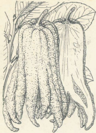
第 1162 圖