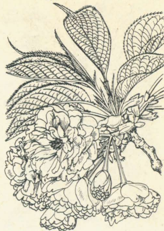
第 1315 圖

我邦中部ヨリ以北ノ山地ニ普通ナル落葉喬木、高サ12m内外、枝極斜メニ上昇ス。やまざくらニ比シテ枝條強剛、暗紫栗殼色ヲ呈ス。葉ハ有柄互生シ廣闊ニシテ倒卵狀廣橢圓形乃至倒卵形ヲ呈シ、長サ6-14cm、先端極メテ急ニ短尾ヲ成ス。質厚クシテ毛ナク、裏面ハ蒼色ナリ。葉底ハ圓キカ或ハ多少心臓形ナリ。葉柄ハ通常紅紫色ヲ呈シ上部ニ二腺アリ。花序ハ二-四花ノ總狀ナレドモ花軸短縮シテ繖形ヲ呈シ嫩葉ト共ニ出デ、花芽鱗片ハやまざくらヨリ短クシテ反曲スルコト少シ。小梗ハ短クシテ直ナリ。花ハ徑3-4.5cmアリテ淡紅紫色ヲ呈ス。萼筒ハ無毛筒狀。花瓣ハ平開シ闊大ニシテ圓形ニ近ク花容やまざくらニ比シテ濃色豊艶ノ觀アリ。四月開花シ七月既ニ結實シテ黒紫色ヲ呈ス。核果ハ球形、長サ11-13mmヲ算ス。和名ハ大山櫻ニシテ大ナルやまざくらノ意ナリ、是レ本來ノ名稱ナリ、故ニ更ニ之レヲえぞやまざくら或ハバビやまざくらト云フハ贅事ナリ。