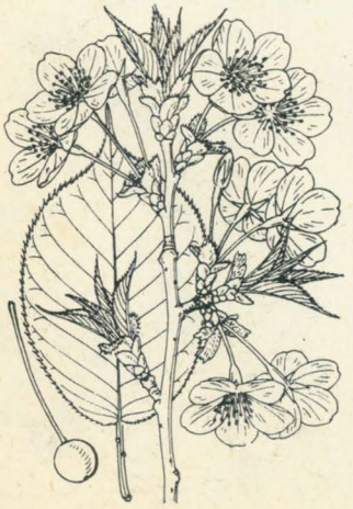
第 1314 圖

伊豆七島殊ニ大島ノ山地ニ多ク自生スレドモ、又廣ク今時各方ニ栽植セラルルヲ見ル落葉喬木。幹ハ直立シ暗灰色ニシテ粗大、多ク分枝シテ斜上シ老樹ニ在テハ四方ニ擴ガル、高サ3-10m内外。葉ハ有柄互生シ倒卵狀長橢圓形或ハ倒卵狀橢圓形ニシテ末長ク尖リ底部圓形、長サ10cm内外ニ達シ邊緣芒尖鋸齒ヲ連ネ、兩面無毛ニシテ平滑、裏面ハ粉白ナラズ。花ハ四月ニ開キ淡綠色或ハ微赤褐色ノ新葉ト共ニ出デ、大形ニシテ徑3-4cmヲ算シ、往々香氣アリ、白色或ハ微紅色ヲ帯ビ往々開テ枝上ニ滿ツ。花序ハ花軸やまざくらヨリ長クシテ強ク萼ト共ニ淡綠色ニシテ敢テ紫染セズ又毛ナシ。萼筒ハ筒狀、萼片ハ披針形ニシテ平開シ多少ノ鋸齒アリ。花瓣五片平開シ橢圓形ニシテ凹頭。多雄蕊。一雌蕊、子房花柱共ニ無毛。核果ハ球形、やまざくらヨリ稍大形ニシテ紫黑色ニ成熟ス。和名大島櫻ハ伊豆七島中ノ大島ニ産スルヨリ云フ、同島ニハ櫻桃ト稱シテ一古樹アリ(forma stellata Makinoニシテ五花瓣互ニ相離ル)。本品ハやまざくらノ變化セシ者ナリ。