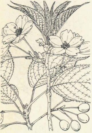
第 1313 圖

(=P. serrulata Lindl. var. spontanea Mak.) 我邦中部ヨリ以南九州屋久島ニ至ル山地ニ生ジ又往々栽植セラルル落葉喬木。幹ノ高サ7m内外ニ達シ、幹ハ直聳シテ分枝シ、樹皮ニ横理アリ、灰色又ハ暗褐色白又ハ暗灰色ヲ呈シ、小枝ハ無毛ニシテ皮目散點ス。葉ハ有柄ニシテ互生シ倒卵形ニシテ葉頭長ク鋭尖ヲ成シ葉縁ニ針尖狀ノ重鋸齒アリ、長サ10cm内外、葉片竝ニ葉柄ハ全然無毛ニシテ葉ノ上面ハ綠色、裏面ハ帯白淡綠色ナリ。葉柄ノ上部ニ通常二腺アリ。四月頃、花ハ通常赤褐色ノ新葉ト共ニ出デ、花軸ノ短キ繖房花序又ハ繖形繖房花序ヲ成シ淡紅白色ノ有梗三五花ヲ着ク。花梗ハ細長ニシテ毛ナク基部ニ小苞ヲ具ヘ長サ2cm許。花軸ハ長サ凡2cm内外ニシテ基部ハ芽鱗ヲ以テ擁セラル。萼ハ五片平開シ筒部ハ圓柱形ニシテ萼片ト共ニ毛ナシ。花瓣五片平開シ各片凹頭ヲ有ス。多雄蕊。一雌蕊、子房花柱ニ毛ナシ。花後小ナル球形ノ核果ヲ結ビ熟シテ紫黑色ト成リ多汁ナリ。和名山櫻ハ山ニ生ズルさくらノ意、さくらハ其語原判然セザレドモ中ニハ神代時分ノ歌謡中「さきくにさくらん、ほさきくにさくらん」ノ語中ヨリ出シモノト謂フ説モアリ。漢名 櫻桃(誤用)