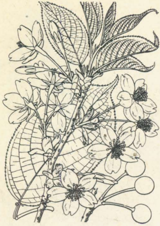
第 1312 圖