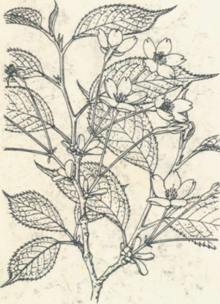
第 1319 圖

本州中部ノ山地ニ生ズル落葉小喬木、高サ4m内外。葉ハ互生シ倒卵狀橢圓形ニシテ長サ5cm内外、有尾銳尖頭ヲ成シ、稍缺刻狀ノ整正鈍鋸齒ヲ刻ミ、底部ハ稍圓ク、短柄アリ。質多少厚ク、鮮綠色ヲ呈シ、兩面ハ葉柄ト共ニ短軟毛ヲ密布ス。早春、葉尙舒ビザル前ニ開花ス。小ナル繖形花序ヲ成シテ下垂シ、二三花ヨリ成リ花軸ハ極メテ短シ。花ハ長サ15mm内外、萼筒ハ筒狀、下端僅ニ膨腫シ、外面紅染シテ短毛ヲ布ク。花瓣ハ萼ニ比シテ甚ダ小形、倒卵形ニシテ嚙痕ヲ有シ、淡紅色ヲ呈スレド顯著ナラズ。花柱ハ下半部ニ鬚毛ヲ有ス。核果ハ球形ニシテ黒熟ス。和名ハ丁子櫻ノ意ニシテ其花形ニ基ク。目白櫻ハ其帶白色小形花ノ形容ニ基キ名ケタルナリ。學名ノ種名 apetala (無瓣)ハ花瓣ノ謝落セシ標品ヲ見テ之レヲ無瓣花ト誤解シ乃チ此語ヲ用キシモノナリ。