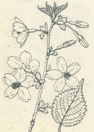
第 1320 圖

中部以北ノ高山帯ニ生ズル落葉ノ喬木・亞喬木或ハ灌木様本ニシテ枝條ハ紫褐色ナリ。葉ハ有柄ニシテ互生シ、葉柄ハ細クシテ毛ナク上部ニ微小ナル二腺アリ、葉片ハ倒卵狀橢圓形或ハ倒卵形ニシテ長サ5cm内外、有尾銳尖頭、葉緣ニ重鋸齒ヲ有シ、質薄クシテ多クハ無毛ナリ。五-六月頃、融雪後間モナク赤褐色ノ新葉ト共ニ淡紅色可憐ノ花ヲ開ク。花序ハ繖形狀或ハ繖房様ヲ呈シ二三花ヨリ成リテ毛ナク、芽鱗ハ短クシテ赤褐色ヲ呈ス。花軸ハ短ク或ハ不明、花梗ハ細クシテ長シ。萼筒ハ無毛狹筒形、萼片ニハ細鋸齒アリ。花冠ハ正開セズ、其質やまざくらニ類シ白色淡紅采、雄蕊ハ多數、雌蕊ハ一箇ニシテ花柱ハ全ク無毛。八月既ニ小球狀ノ核果ヲ結び黒熟ス。和名ハ嶺櫻又ハ高嶺櫻ノ意ナリ。