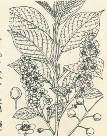
第 1323 圖

北海道・樺太ノ山野ニ自生スル落葉喬木ナリ。樹皮ハ黒褐色、一年生枝ハ多ク平滑ナリ。葉ハ倒卵狀橢圓形、急銳尖頭、楔狀鈍底又ハ圓底、邊緣ハ細鋸齒、兩面無毛、長サ4-10cm、幅3-7cm内外アリ。五月ノ候、小枝端ニ總狀花序ヲ成シテ有梗ノ小白花ヲ撒シ開ク。萼ハ鐘形、無毛、五淺裂シ、裂片ハ卵形ニシテ腺緣ナリ。花瓣ハ平開シ、五片、白色ニシテ圓形。雄蕊ハ多數アリテ花瓣ヨリ短シ。核果ハ球形ニシテ黒熟ス。本品ハ概形うはみづざくらニ似タレドモ葉ハ支脈多クシテ鋸齒著シク小ク花瓣ハ雄蕊ヨリ超出シ萼裂片ハ卵形ニシテ稍大ナルヲ以テ異ナリ。核果ハ球形ニシテ黒熟ス。あいぬハ其樹皮ヲ藥用トシ又茶ノ代用トス。和名ハ蝦夷の上みづざくらノ意ナリ。