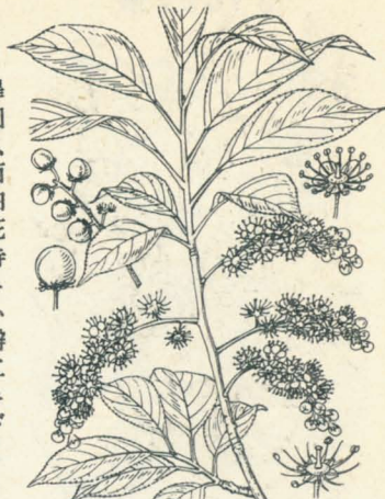
第 1321 圖

山野ニ生ズル落葉灌木。樹皮ハ暗灰色ニ稍光澤アリ、小枝ハ灰白色ヲ呈ス。葉ハ倒卵狀長橢圓形又ハ長橢圓形、銳尖頭、楔底、長サ6-10cm、幅2.5-3.5cm、兩面殆ド無毛ナレドモ時ニハ下面中脈ニ沿テ鬚毛ヲ生ズルコトアリ、邊緣ニハ細銳鋸齒アリ。花穂ハ二年生枝ニ側生セル總狀花序ニシテ多數ノ有梗小白花ヲ綴リ四月新葉ノ時開キ花序ノ基部ニ葉ヲ有セズ。花軸及ビ花梗ニ密毛アリ。萼ハ廣鐘形ヲ成シテ五尖裂シ裂片ハ卵形ニシテ腺緣ヲ有シ雄蕊ト共ニ宿存ス。花瓣ハ平開シ五片ニシテ倒卵狀圓形、雄蕊ハ十二-二十アリテ少シク花瓣ヨリ超出ス。核果ハ球形ニシテ稍銳頭ヲ成シ熟スレバ初メ帶黃赤色ナレドモ遂ニ紫黒色ヲ呈スルニ至ル。和名犬櫻ハざくらニ類シテ非ナル故斯ク云フ。