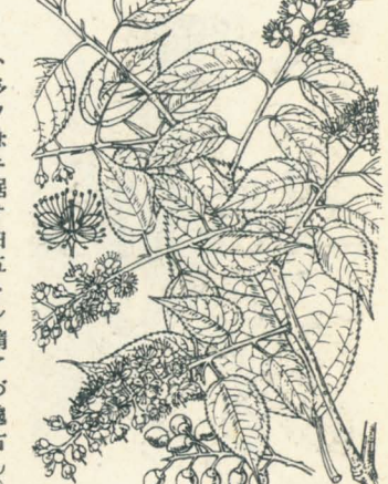
第 1322 圖

山野ニ生ズル落葉喬木、高サ10m内外ニ達シ、樹皮ハ褐紫色ヲ呈ス。枝上ノ小枝ハ晩秋初冬ノ落葉直後ニ多クハ脱落スルノ特徴アリ、故ニ其脱痕ハ枝上ニ結節ヲ呈ス。葉ハ有柄互生シ橢圓形ヲ呈シ、尾端ヲ成セル急銳尖頭、圓底、長サ6-9cm、幅3-5cm許、幼時ニハ葉脈ニ毛アレドモ長ズレバ殆ド無毛ト成リ、葉緣ニ芒尖細鋸齒アリ、乾ケバ膜質ヲ呈ス。四五月ノ候、小枝端ニ長サ10cm、幅2cm内外ノ總狀花序ヲ成シテ多數ノ有梗小白花ヲ撒シ開ク。萼ハ廣鐘形ヲ成シ無毛ニシテ淺ク五裂シ裂片ハ小形全縁三角狀、内面ニ絨毛アリ、雄蕊ト共ニ花托ヨリ謝落ス。花瓣ハ五片倒卵形ニシテ平開シ後背反ス。雄蕊ハ多數ニシテ花瓣ヨリ長シ。核果ハ橢圓狀球形銳頭、初メ黃熟シ後黒熟シテ長サ6-7mmアリ、尙未熟綠色ノ者ヲ鹽藏シ食料トス。和名うはみづざくらハ元來うはみぞざくら(上溝櫻)ノ轉訛ナリ、龜トノ時此材ヲ用ウ、上面ニ溝ヲ彫ル故ニ上溝ト云、古名ノははかハ時ニ山ざくらノ名トスルコトアリ。こんがうざくらハははかがほうかト成リ次ニほうごうざくらト成リ次ニ此こんがうざくらト訛リシモノナリ。