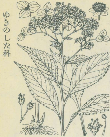
第 1444 圖