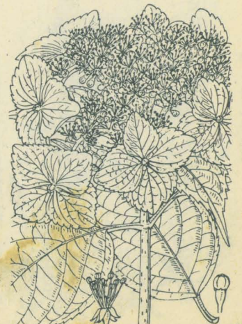
第 1449 圖

山地ニ生ズル落葉小灌木ニシテ高サ1m内外。葉ハ對生、葉柄アリ、小形ニシテ長橢圓形ヲ呈シ、先端尾狀鋭尖頭ヲ成シ鋭鋸齒ヲ有シ、薄ク、脈上ニ細毛ヲ布ク。七月ノ候枝端ニ繖房花序ヲ成シテ白花ヲ着ク。中心ニ正花ト周圍ニ數箇ノ裝飾花片トアリ。裝飾花ハ徑2cm内外ニシテ萼片ハ花瓣狀、三四箇アリ。正花ハ三角形ノ小サキ五萼片ト卵形ノ五花瓣トヲ有ス。雄蕊ハ約十本、花柱ハ概ネ三箇アリ。蒴果ハ小形ニシテ倒卵形ヲ成シ宿存セル花柱ノ間ニ當ル處ニテ開裂ス。和名ハ小額ニシテ小形ナル額あぢさゐノ意ナリ。