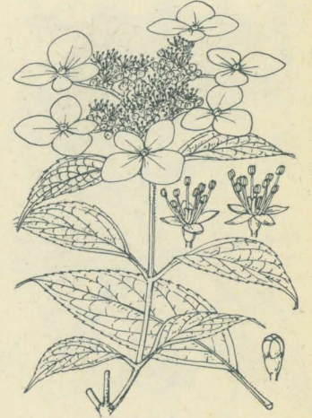
第 1448 圖

暖地海岸ノ山地ニ自生スルモ又庭園ニ廣ク栽植セララル落葉灌木ナリ。莖ハ高サ2m内外ニシテ葉ハ對生シ有柄、卵形或ハ倒卵形ヲ成シ質厚ク滑澤ニシテ邊緣ハ殊ニ上半ニ鈍鋸齒アリ、鋭尖頭楔底ナリ。夏日枝端ニ大ナル繖房花序ヲ成シ、周圍ニ少數ノ大ナル不登花ト中央ニ多數ノ兩全花トヲ着ク。不登花ハ徑5cm許ニ達シ、萼片ハ四或ハ五箇、大形ニシテ花瓣狀ト成リ、通常碧紫色或ハ帶白紫色、時ニ白花(forma leucantha Makino)ニシテ全邊或ハ疎大ノ鋸齒アリ。兩全花ハ三角形ヲ成セル微小ナル五萼片ト橢圓形鋭頭ナル五片ノ花瓣ヲ有ス。雄蕊ハ約十本。花柱ハ三或ハ四箇。蒴果ハ小ニシテ倒卵形、基部ハ狹窄シ頂ニ宿存セル花柱ヲ戴ク。和名ハ紅額あぢさゐノ意ニシテ其花叢ヲ扁額ニ擬シ其周邊ノ蝶形花ヲ額縁ニ比シタルナリ、がくさうハ額草ノ意、がくばなハ額花ノ意ニシテ今日ハ此名ヲ云ハズ、がくヲ萼ノ意トスルハ非ナリ。