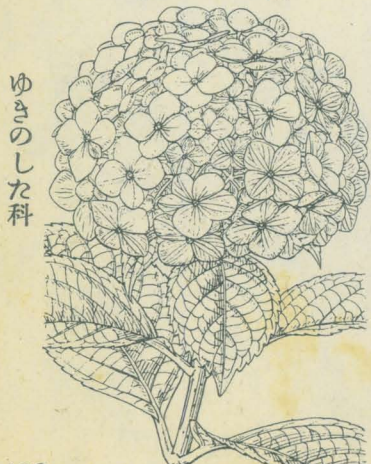
第 1446 圖

山地ノ落葉藤本ニシテ莖ヨリ氣根ヲ出ダシテ岩或ハ樹ヲ攀登シ多ク高處ニ至ル。幹ノ大ナル者徑8cm許ニ達シ其皮頗ル厚シ。葉ハ對生。葉柄ハ細長、赤色ヲ帶ブルコト多シ。葉片ハ廣卵形或ハ卵圓形ニシテ長サ7cm内外、鋭尖頭心臟底、邊緣ニハ鋭尖ノ粗齒アリ、表面暗綠色、往々白綠色ノ斑紋ヲ飾ル。七月頃枝端ニ平頂ノ聚繖花序ヲ着ケ白細花ヲ綴ル。周邊ニハ萼ノ一片白色ノ大ナル卵形花瓣様ニ擴ガレル不登花數箇アリ。花ハ花瓣五箇、雄蕊十本アリテ中央ニ一雌蕊アリ。花柱ハ一箇、頭狀ノ柱頭ヲ有ス。ごとうづニ酷似スレドモ彼ニアリテハ葉淡綠色ニシテ斑紋ナク更ニ長柄ヲ具ヘ、不登花ノ萼片ハ五大片アリ、花柱亦五箇アルニヨリ區別シ得。和名ハ岩絡ノ意ニテ此者能ク氣根ヲ下シテ岩上ニ蔓延生長スルヨリ云フ。