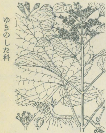
第 1445 圖

山地ニ生ズル多年生草本ニシテ莖ハ高サ20-60cm。葉ハ互生シ、柄ヲ有シ、長橢圓形乃至廣披針形ニシテ兩端尖リ鋭キ鋸齒アリ質薄クシテ細毛ヲ散生ス。八月、莖頭ニ稍繖房狀花序ヲ成シテ淡紅紫色或ハ淡紅白色或ハ白色ノ小花ヲ撰簇ス。周邊ニ徑1-2cm許ナル少數ノ裝飾花アリテ萼片ハ三或ハ二箇、花瓣狀ヲ成シ、廣卵形ニシテ先端稍尖ル。兩全花ハ萼片五箇アリ細小ニシテ三角形ヲ成シ、花瓣モ五箇倒卵形ナリ、多雄蕊、概ネ三花柱。蒴果ハ小形ニシテ倒卵形ヲ成シ宿存セル三花柱ノ中央ニ於テ開裂ス。和名ハ花狀あぢさゐ式ニシテ草本ナル故云フ。