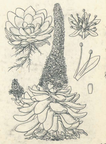
第 1491 圖

蓋シ岩上ニ生ズル多年生草本ニシテ往々藁茸ノ屋上ニ繁茂ス。葉ハ多肉ニシテ粉白色ヲ呈シ、多數相重リテ其形蓮華狀ヲ成シ、篋狀長橢圓形ニシテ通常鈍頭ナリ。秋日葉心ヨリ莖ヲ抽クコト15-28cm許、莖葉ヲ互生シ、概ネ分枝シ、枝端ニ總狀ヲ成シテ白色ノ小花ヲ密生ス。苞ハ卵形ニシテ稍鋭頭。花ハ短梗ヲ有シ、二箇ノ細キ小苞ヲ具フ。萼片ハ五箇アリ淡綠色、披針形。花瓣モ五箇、倒披針形ニシテ鋭頭、萼片ノ倍長アリ。雄蕊ハ十本、花瓣ヨリ少シク長シ。子房ハ五箇、花柱ハ短ク、鱗片ハ微小ニシテ長方形ナリ。蓇葖ハ長橢圓形ニシテ兩端尖ル。和名ハ岩蓮華ノ意ニシテ岩ハ其生處、蓮華ハ其相層ナレル葉狀ヲ云フナリ。