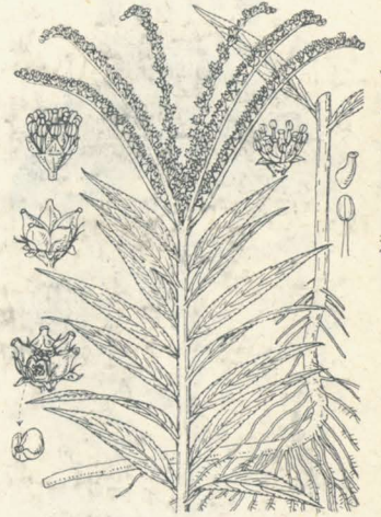
第 1490 圖

原野ノ濕地ニ生ズル多年生草本ニシテ莖ハ圓柱形ニシテ直立シ柑色ヲ呈シ高サ70cm内外。葉ハ多數莖上ニ着キ狭披針形ヲ成シテ互生シ、鋭頭ニシテ狭底、殆ド柄無ク、邊緣ニ微細ナル鋸齒ヲ有シ、幅1cm以内ナリ。夏日梢上ニ數枝ヲ分チ、每枝ニ總狀ヲ成シテ其花軸ノ一側ニ黃白色ノ小花ヲ排着シ初メ背卷ス。花序ニハ短腺毛ヲ散生シ、各花ノ小梗ハ極メテ短シ。萼ハ五裂シ裂片ハ卵形ニシテ鋭頭。花瓣無ク裸花ナリ。雄蕊ハ十本萼ヨリ長シ。子房ハ五箇基部合體シ、卵形ニシテ花柱ハ短シ。蒴果ハ五室輪列シテ下部合體シ各室ノ外部ハ帽狀ヲ呈セル蓋片ト成リテ相離レ開裂シ細種子ヲ出ス。和名蛸ノ足ハ其花穂ノ分岐シテ蛸ノ脚狀ヲ成セルニ擬シ、澤紫苑ハ澤地ニ生ズル紫苑ノ意ナリ。漢名 扯根菜(誤用)