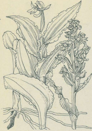
第 2104 圖

のびねちごり Platanthera camtschatica Makino. (= Orchis camtschatica Cham. et Schlecht. ; Neolindleya camtschatica Nees. ; Gymnadenia camtschatica Miyabe et Kudo. ; P. decipiens Lindl. ; N. decipiens Kränzl. ; G. Vidalii Franch. et Sav. )