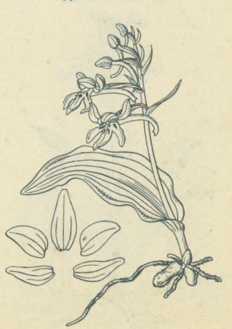
第 2109 圖

ひなちごり Orchis Chidori Schlecht. (= Gymnadenia Chidori Makino. )