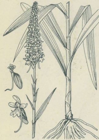
第 2105 圖

ちごりさう 一名 てがたちどり Gymnadenia conopsea R. Br. (= Habenaria conopsea Benth. )