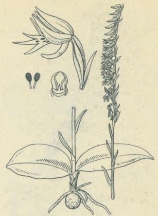
第 2107 圖

みやまもちずり Neottianthe cucullata Schlecht. (= Orchis cucullata L. ; Gymnadenia cucullata Rich. ; Himantoglossum cucullatum Reichb. )