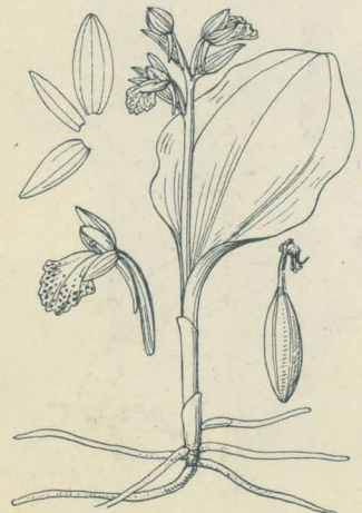
第 2106 圖

かもめさう 一名 かもめらん(同名アリ)・いちえふちどり Gymnadenia cyclochila Korsh. (= Orchis cyclochila Maxim. )