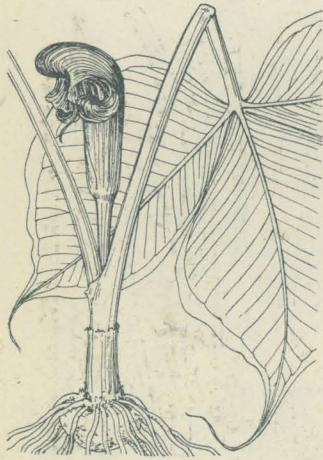
むさしあぶみ Arisaema ringens Schott.

西部及南部ノ海ニ近キ地ノ林中ニ生ズル多年生草本。球莖ハ稍平球形ニシテ二ノ小仔球莖ヲ伴フ。偽莖ハ一本直立シ短大ニシテ淡綠色ヲ呈シ、莖ノ上部ニ二葉ヲ出ダシ、葉ハ對生セル如ク接近シ、葉柄ハ淡綠色ニシテ斜上ス。葉面ハ三小葉ヨリ成リ、小葉ハ無柄闊大、卵狀廣橢圓形ニシテ全邊、先端ハ急ニ尖リテ尾狀ヲ成シ底部亦銳尖、長サ15cm内外ナレド大ナルハ30cmヲ超ユルニ至ル。鮮綠色ニシテ質軟カク、光澤ニ富ミ、裏面ハ淡色白霜ヲ帯フ。五月二葉間ニ一短梗ヲ直立シテ一肉穂花序アリ。佛焰苞ハ特異ノ形狀ヲ呈シ、鞍部ノ上半ハ卵形ニシテ前方ニ突出スレドモ中央背部ハ囊狀ヲ成シテ彎曲シ、一見兜或ハ鐘ノ如シ。外面ハ綠白條交互シ、内面ハ黒・紫ニ縦縞ヲ成ス。筒部喉邊ニハ耳狀アリテ開張シ、中央ニ大ナル白色ノ肉穂軸附飾物立チテ棍棒狀ヲ呈シ、先端ハ鈍形ニシテ卵ノ内側ニ入レリ。果實ハ太キ穂軸面ニ排ビ着キテ赤熟ス。偽莖ノ暗紫色ナル一變種ヲむらさきむさしあぶみ (var. Sieboldii Engl.) ト云フ。和名ハ武蔵鐘ノ意ニテ其佛焰苞ノ形狀ニ象ドリ、武蔵鐘トハ昔武蔵ノ國ニテ製出セシあぶみナリ。