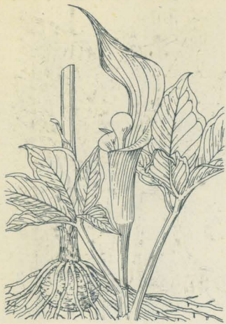
ゆきもちさう 一名 くわんきさう Arisaema sikokianum Franch. et Sav.

中部以南ノ山地樹林下ニ生ズル多年生草本。球莖ハ平圓形。頸部ニ多數ノ鬚根ヲ發出ス。偽莖ハ一本直立シ圓柱形ニシテ多葉、長サ20-30cm許アリ、頂ニ二葉相接近シテ出ツ。葉ハ鳥趾狀葉ニシテ三或ハ五個ノ小葉アリ、小葉ハ橢圓形、兩端概ニ銳尖形ヲ成シ、葉縁全邊或ハ鋸齒アリ、葉面或ハ時ニ白斑アリ。五六月ノ候、葉間ニ有柄ノ一肉穂花序ヲ抽出ス。佛焰苞ハ紫褐色ヲ呈シ、筒部ハ長サ5cm内外、上部喉口ニ近ツキテ急ニ放大シ、鞍部ハ直立シ長サ8cm内外、倒卵狀橢圓形ニシテ先端ハ尾狀銳尖頭ト成リ、下部亦銳尖狀ニ狹窄シテ筒部トノ境界明瞭ナリ。肉穂花序ノ附飾物ハ著シキ棍棒狀ニシテ佛焰苞筒ヨリ超出シ、先端ハ急ニ圓ク膨大シ其色雪白ナルヲ以テ苞トノ對照甚ダ著シ。雌雄異株、雄本ニ在テハ肉穂ノ下部ニ多數ノ雄花ヲ散着シ、雌本ニ在テハ綠色子房ヨリ成ル雌花ヲ集着シ。漿果ハ肉穂軸ニ多數集着シテ卵狀橢圓形ヲ呈シ赤熟ス。和名雪餅草ハ花軸附飾物ノ頭、圓形ニシテ雪白色ナレバ云ヒ、歡喜草ハ人アリ此草ヲ得テ歡喜セルヨリ斯ク名ケタリ。