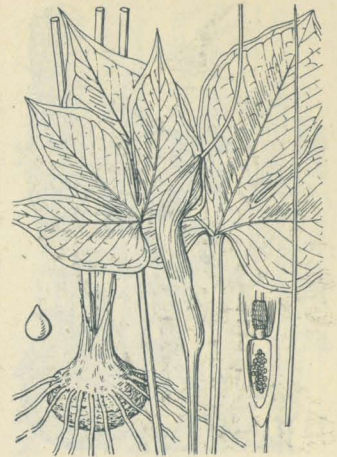
第 2330 圖