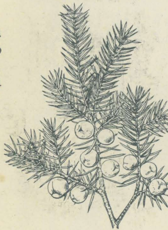
第 2688 圖