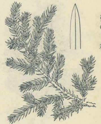
第 2691 圖